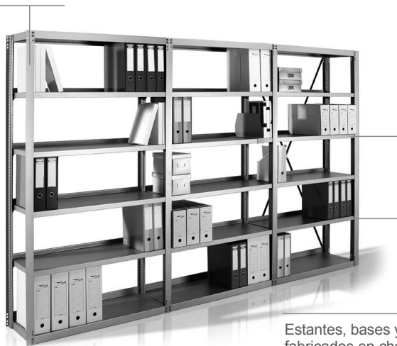
Estantes, bases y cubiertas fabricados en chapa de acero de 0.8 mm.

Postes compuestos por tres semiperfiles fabricados en acero de espesor 0.9 mm. ranurados.